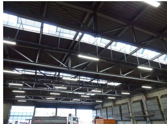
LED-Beleuchtung mit intelligenter Steuerungstechnik