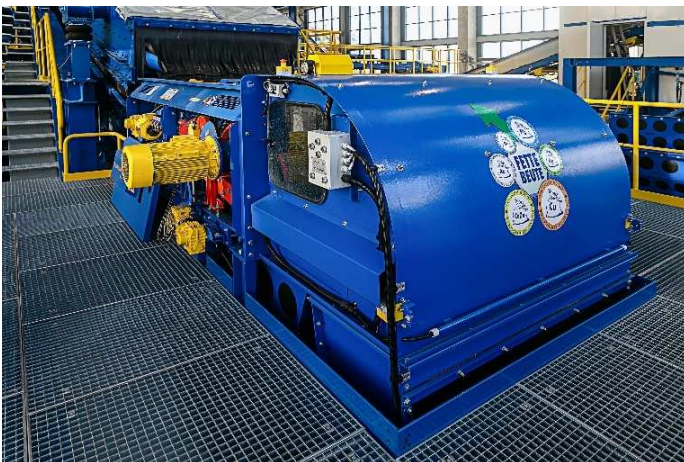
NE-Abscheider „Fette Beute“